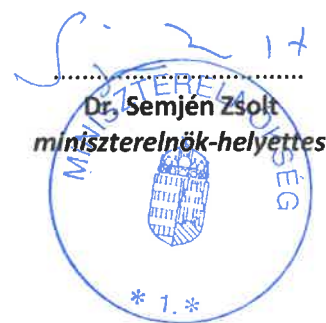
Dr. Semjén Zsolt miniszterelnök-helyettes